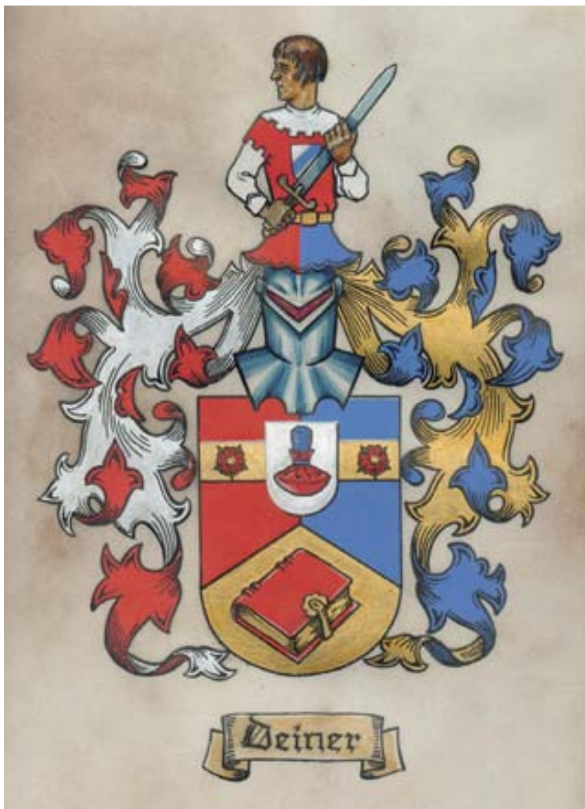
Wappen der Familie Deiner