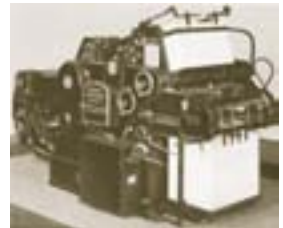
Heidelberg KORD – 1970

1976 1. Fotosatzanlage in Lörrach mit automatischer Filmbelichtung und Entwicklung im eigenen Hause