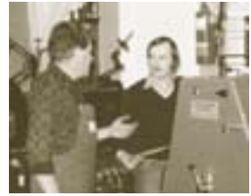
Maschineneinweisung GTO – 1979