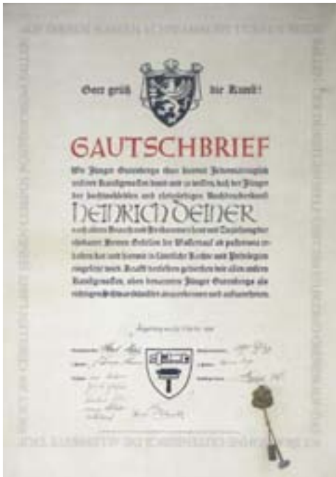
Gautschbrief aus dem Jahre 1930