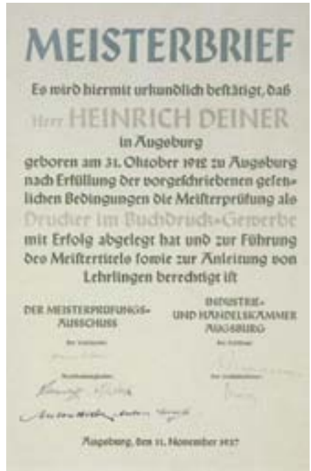
Meisterbrief aus dem Jahre 1937