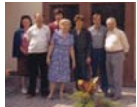
Gruppenbild zum 25. Jubiläum 1982