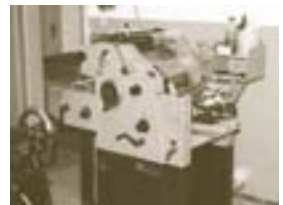
Iteck 1-Farben – 1972

1983 Digitalgesteuerte Reprokamera Ravenna vollautomatisch im DIN A2 -Format