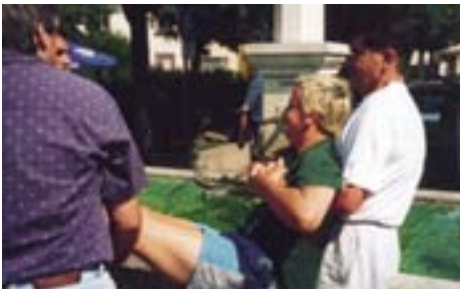
„Packt an! Lasst seinen Corpus Posterior fallen ...“