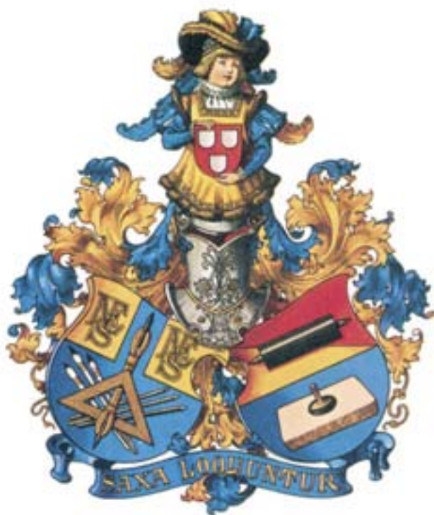
Wappen der Lithographen, Steindrucker und Offsetdrucker