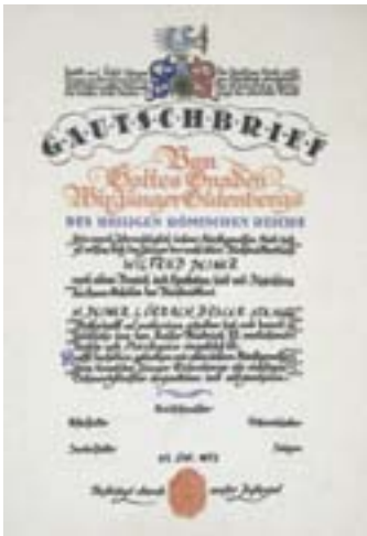
Gautschbrief und Meisterbrief aus den Jahren 1972 und 1987