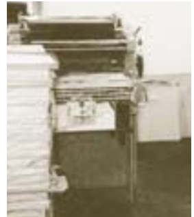
1. Offsetdruckmaschine MGD – 1968

1968 1. Offsetdruckmaschine in Lörrach DIN A3 -Überformat