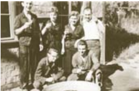
Erste Gautschfeier 1961