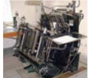
Heidelberg Tiegel – 1979