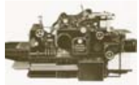
Heidelberg Zylinder – 1960

1957 Firmengründung mit 2 Angestellten und gebrauchten Maschinen. Heidelberger Tiegel (DIN A4) und Mailänder (DIN A2)